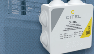
H CL-DSL SPD zum Schutz der Telefonanlage (TAE) Artikel Nr. 6400066