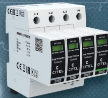
A DAC1-13VG6S-31-275 Kombi-Ableiter Typ 1+2+3 zum Schutz der Hauptverteilung Artikel Nr. 821730244