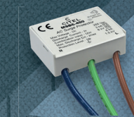
D MSB6-400 SPD Typ 3 zum Schutz der Steckdosen Artikel Nr. 561302