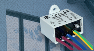
E MLPX1-230L-W SPD Typ 2+3 zum Schutz von 230V Stromkreisen Artikel Nr. 711214