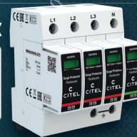
C DAC50VG6S-31-275 Kombi-Ableiter Typ 2+3 zum Schutz der Hauptverteilung Artikel Nr. 821130244