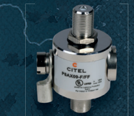
F P8AX09-F/FF SPD zum Schutz der SAT-Anlage Artikel Nr. 60211