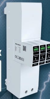
B ZPAC1-13VG-31-275 Kombi-Ableiter Typ 1+2+3 zum Schutz der Hauptverteilung Artikel Nr. 64004