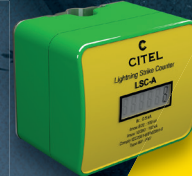
I LSC-A Blitzimpulszähler für die PAS Artikel Nr. 790121